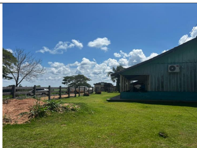
IMAGEM 02: ESCOLA MULTISSERIADA ÁGUA VIVA – ÁREA EXISTENTE SEM INTERVENÇÕES