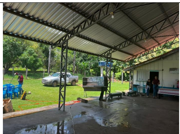
IMAGEM 09: ESCOLA MULTISSERIADA ÁGUA VIVA – ÁREA EXISTENTE SEM INTERVENÇÕES