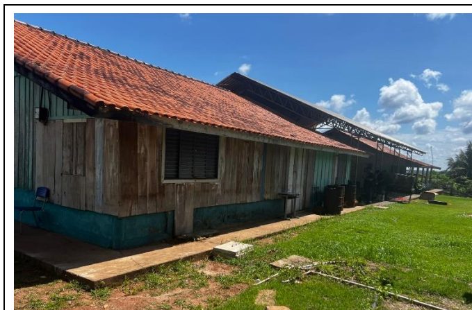
IMAGEM 03: ESCOLA MULTISSERIADA ÁGUA VIVA – ÁREA EXISTENTE SEM INTERVENÇÕES