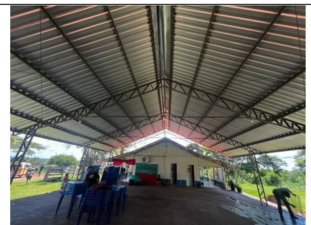
IMAGEM 10: ESCOLA MULTISSERIADA ÁGUA VIVA – ÁREA EXISTENTE SEM INTERVENÇÕES