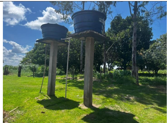
IMAGEM 08: ÁREA DA LOCAÇÃO DA AMPLIAÇÃO – ÁREA EXISTENTE SEM INTERVENÇÕES