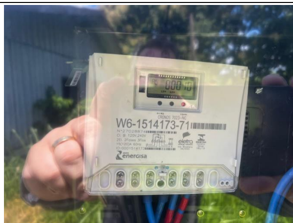
IMAGEM 12: PADRÃO DE ENERGIA