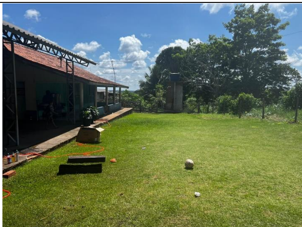
IMAGEM 07: ESCOLA MULTISSERIADA ÁGUA VIVA – ÁREA EXISTENTE SEM INTERVENÇÕES