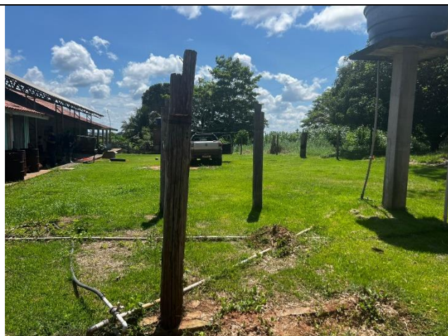
IMAGEM 06: ÁREA DA LOCAÇÃO DA AMPLIAÇÃO – ÁREA EXISTENTE SEM INTERVENÇÕES