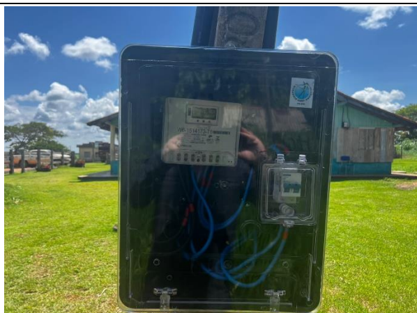
IMAGEM 11: PADRÃO DE ENERGIA