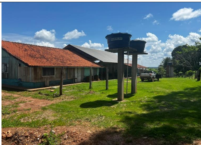
IMAGEM 05: ESCOLA MULTISSERIADA ÁGUA VIVA – ÁREA EXISTENTE SEM INTERVENÇÕES