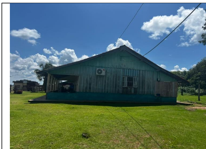
IMAGEM 01: ESCOLA MULTISSERIADA ÁGUA VIVA – ÁREA EXISTENTE SEM INTERVENÇÕES

LOCAL: ASSENTAMENTO ÁGUA VIVA – CHUPINGUAIA/RO