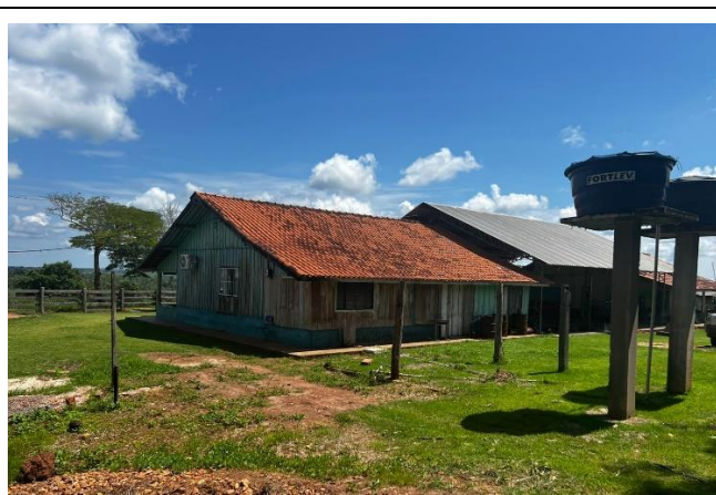
IMAGEM 04: ESCOLA MULTISSERIADA ÁGUA VIVA – ÁREA EXISTENTE SEM INTERVENÇÕES FONTE: MAMORÉ, 2026